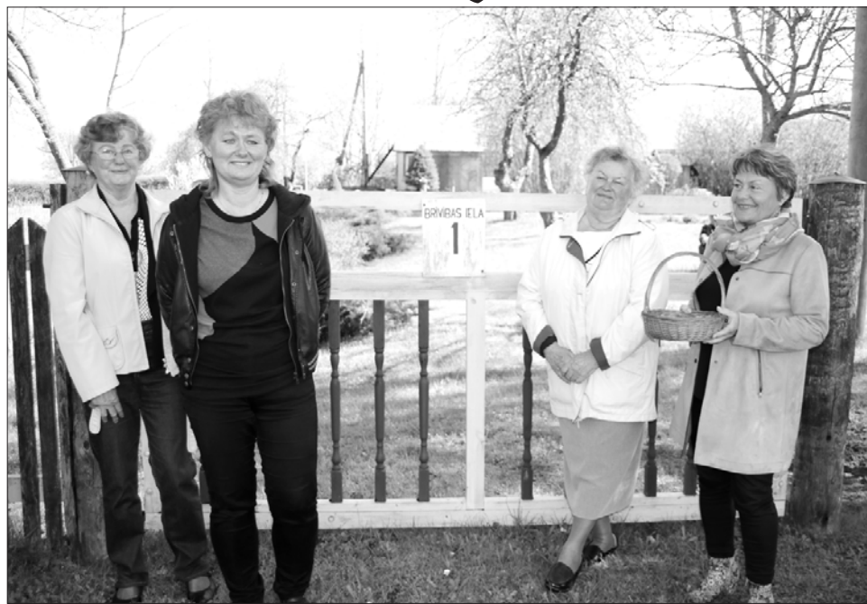
Sprūdu dzimta gliņi iekopj sava nama apkārtni Brīvības ielā 1.