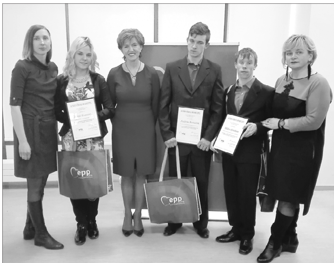
Skolēni un skolotājas no Purmsātiem kopā ar Eiropas Parlamenta deputāti Inesi Vaideri.

Eiropas Parlamenta deputātes profesore Inese Vaideres rīkotā vidusskolēnu darbu konkursa "100 vēstures mirkļi novadā – vietas un cilvēki" noslēguma pasākums pulcēja skolēnus no 37 dažādām Latvijas skolām, starp kuriem bija arī purmsātnieki.