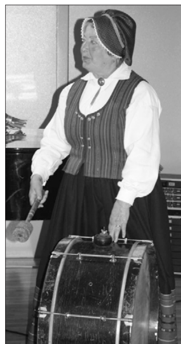
Skaidra Klasiņa koncertā dalījās atmiņās un iedvesmoja kopīgi nodziedāt spēka dziesmu.